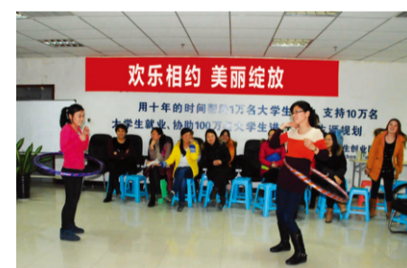
游戏“转呼啦圈穿别针”

为欢庆“三八”国际劳动妇女节，彰显女员工风采，提升女员工的自信心，全面拓展女员工的综合素质，3月7日下午，公司特为全体女员工精心安排了一系列精彩纷呈的“三八节”活动。