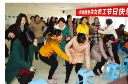
游戏“前方有难，后方支援”